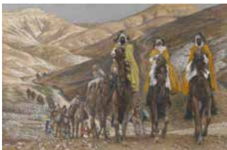
Tři králové a kůň Magi – nosící dárky v Argentině

V Argentině začínají Vánoce 6. ledna, tudíž v době, kdy je na druhé straně planety léto v plném proudu. Ani to ale Argentince nezastaví v tom, aby si zelené, většinou palmové, stromy neozdobili alespoň bílými chomáčky připomínajícími sněž – takové totiž v tu dobu rostou v okolních lesích. Večeri se obvykle venku s celou rodinou a k hlavním chodům večera patří pečený páv. Dárky naděluje kůň Magi (jeden z koní tří králů), kterému se před dveře domu přidá miska s vodou a stébla sena, aby na své pouti za Ježíškem netrpěl žízní a hladem. Dárčky se dětem dávají většinou do jimi vyčištěných bot, které si položí pod „stromček“ nebo vedle postele. Velmi oblíbenou činností je například hromadné vypouštění lampionů štěstí nebo velký ohňostroj v brzkých ranních hodinách.