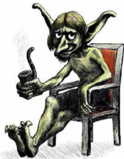
Kallikantaros – malý a zlý skřet/čert, tropící neplechu v řeckých domácnostech

V Řecku jsou Vánoce druhým největším svátkem hned po Velikonocích. Štědrý den je 25. prosince, ale příprava na Vánoce začíná už 40 dní před ním. Protože v Řecku seženete vánoční stromček jen s velkými obtížemi, většina domácností má na stole misku s vodou, bazalkou a dřevěným křížem. Celá miska je pak ozdobena malými barevnými nitkami. Každý jeden den pak vybraný příslušník rodiny obchází každou místnost v domě a pomocí namočeného kříže v této posvátné vánoční vodě dům světlí. A to vše na ochranu proti kallikantarům, malým, ale velmi nebezpečným a zlým skřetům, kteří mohou za většinu pohrom v domácnosti: zkyslé mléko, zhasínání ohně a podobně.