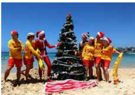
Australské „letní“ Vánoce

V Austrálii sice Santu mají, ale podobně jako v Argentině i tam je léto běžným ročním obdobím pro tuto část zeměkoule. Malý rozdíl byste ale přece jen našli, Vánoce se většinou slaví na rozpálené písčité pláži při hraní kriketu. I stromček