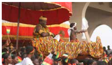
Ghanský vánoční průvod v tradičních slavnostních kostýmech

A co taková Afrika? V Ghaně se Vánoce slaví také velkými rodinnými večeřemi. Děti vyzdobí celý dům papírovými vánočními dekoracemi, které si povětšinou vyrobí ve škole, a dospělí se obléknou do různobarevných tradičních kostýmů, zformují velký průvod a jdou od domu k domu, kde mezi všudypřítomné děti házejí sladkosti a tradiční pochoutky.