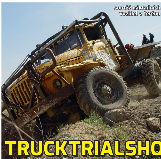
soutěž nákladních vozidel v terénu